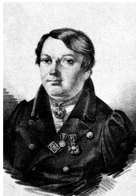
Рисунок 2. Профессор Л.А. Цветаев. Литография. Первая треть XIX в. Figure 2. Professor L.A. Tsvetajev. Lithography. First third of the XIX century

Статус учителей в дворянском обществе был невысок [Гончаров, 2011, с. 135] и, по крайней мере, до 1830-х гг., учителя занимали на социальной лестнице место ненамного более почтенное, чем прислуга. Однако в московском обществе отношение к преподавательскому труду было более уважительным, чем в петербургском. Во многом традиции любви к просвещению и почтения к просветителям всех рангов было заложено здесь еще с середины XVIII века благодаря Московскому университету и университетскому Благородному пансиону, вокруг которых сложилось уникальное сообщество [Пономарева, Хорошилова, 2007]. В 1828 г. в Екатерининском институте праздновали уже восьмой выпуск воспитанниц. «Дамский журнал», выпускавшийся в университетском издательстве, по этому случаю опубликовал статью «О выпуске девиц Екатерининского института», где подчеркивалось, что «институт ордена св. Екатерины всегда имел учителями профессоров университета. Первым был И.А. Гейм, вторым Л.А. Цветаев (рис. 2), в продолжение 23 лет, и чрезвычайно много способствовал к усовершенствованию института» [О выпуске девиц..., 1828, с. 119–120].