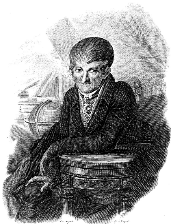
Рисунок 1. Профессор И.А. Гейм. Гравюра начала XIX в.